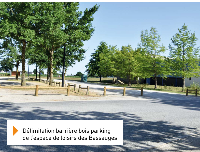
▶ Délimitation barrière bois parking de l'espace de loisirs des Bassauges