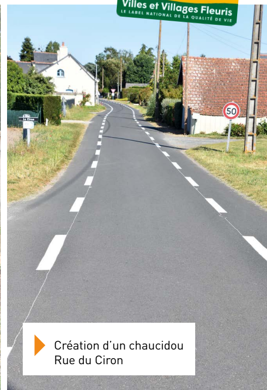
▶ Création d'un chaudiou Rue du Ciron