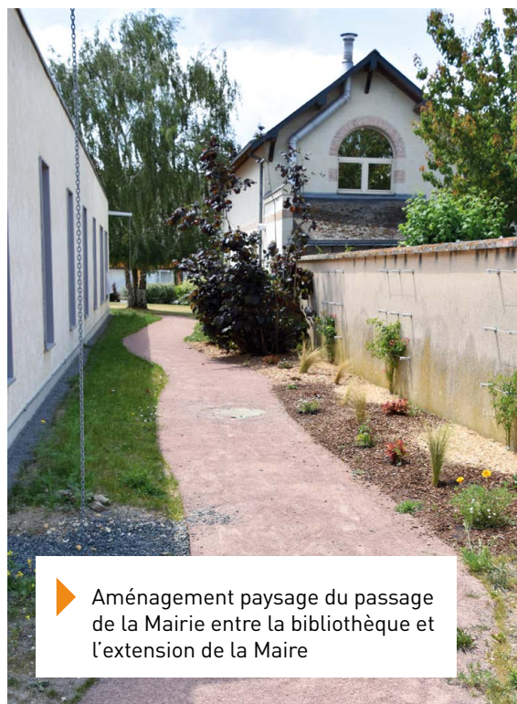
▶ Aménagement paysage du passage de la Mairie entre la bibliothèque et l'extension de la Maire