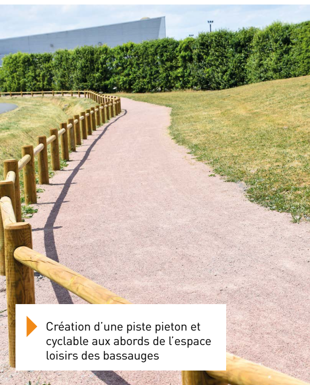
▶ Création d'une piste piéton et cyclable aux abords de l'espace loisirs des bassauges