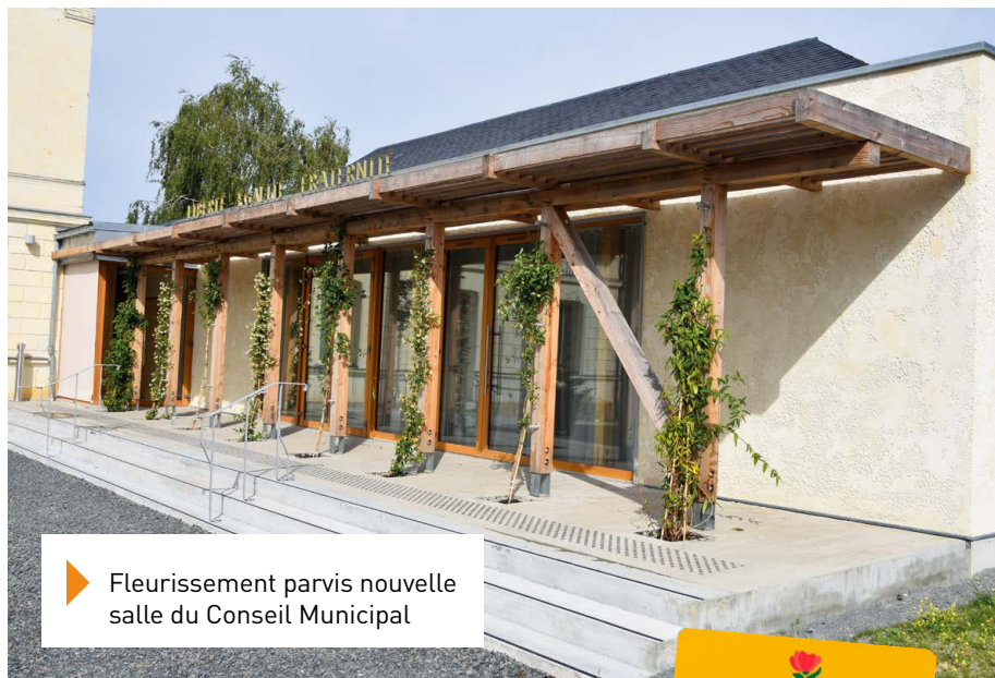
▶ Fleurissement parvis nouvelle salle du Conseil Municipal